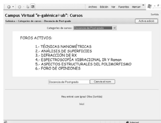
Figura 2. Foros activos

En este contexto se han creado distintos foros, promovidos por los profesores y también por algunos de los alumnos. En la Figura 2 se muestran los distintos foros creados.