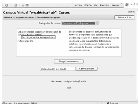
Figura 1. Docencia de Postgrado

El material que se presenta en esta comunicación se articula entorno al seminario “Preformulación III: Caracterización química y estructural de sistemas farmacéuticos” del tema “I+D+I” (fig 1).