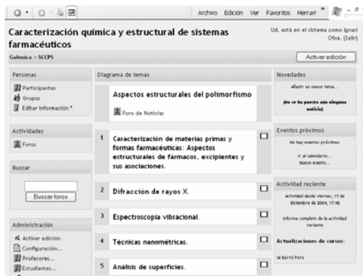
Figura 4. Temas del mes